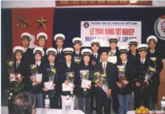
Lễ trao bằng tốt nghiệp lớp 9431 ngành Điện tàu thủy