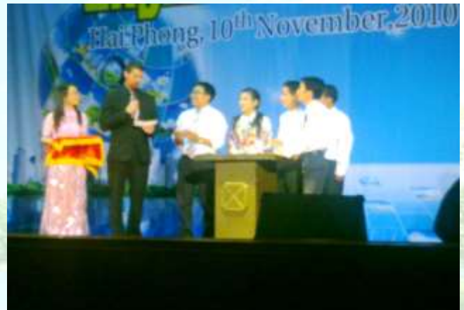
Đội tuyển Khoa đạt giải Ba cuộc thi English contest năm 2010