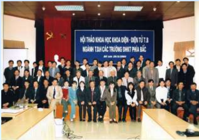
Hội thảo khoa học Khoa Điện-ĐTTB và ngành TĐH các trường ĐHKHT phía Bắc năm 2004