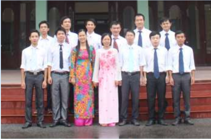
Tập thể GV Bộ môn Điện tự động công nghiệp