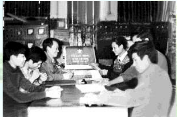
Tổ Chuyên môn thời kỳ 1974 - 1976