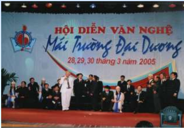
Hợp ca của cán bộ giảng viên khoa Điện - ĐTTB tại Hội diễn văn nghệ toàn trường năm 2005