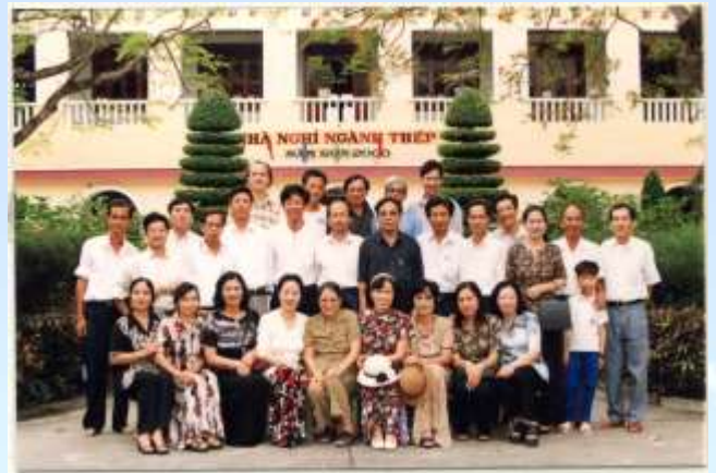
Tập thể lớp điện 241 (Khóa 1967-1972) trong ngày họp lớp