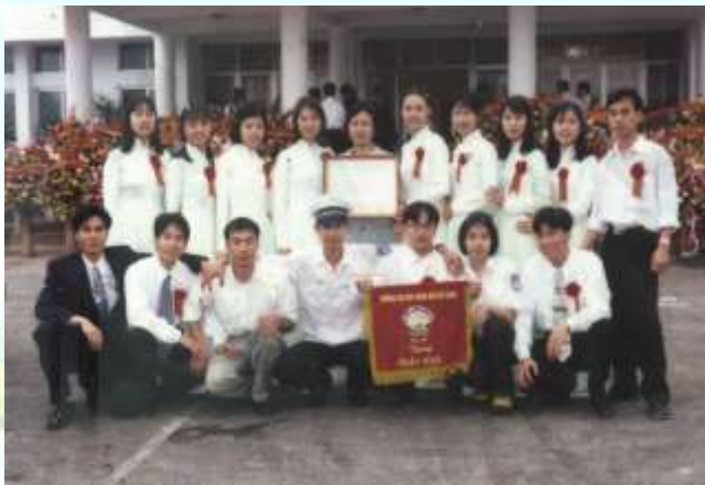
Đội văn nghệ của Khoa đạt giải Nhì hội diễn văn nghệ toàn trường năm 2001