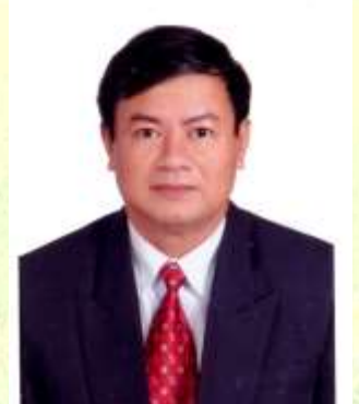
TK từ 2005 đến 2014