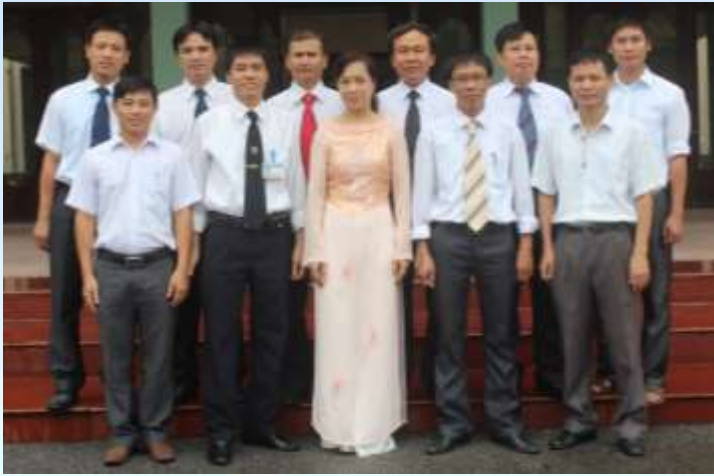
Tập thể GV Bộ môn Tự động hóa hệ thống điện