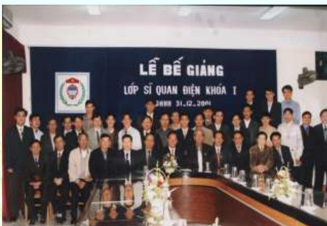
Lễ bế giảng lớp sỹ quan điện Khóa 1 năm 2001