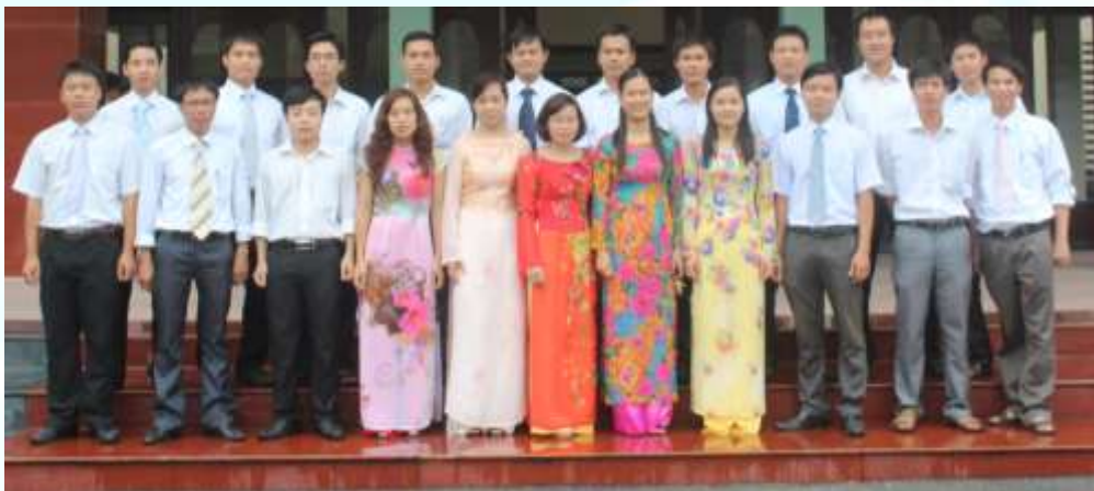
Tập thể các đ/c trong Chi đoàn GV