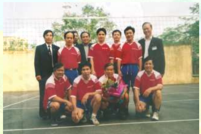
Các thầy giáo của Khoa tại giải bóng chuyền toàn trường năm 2002