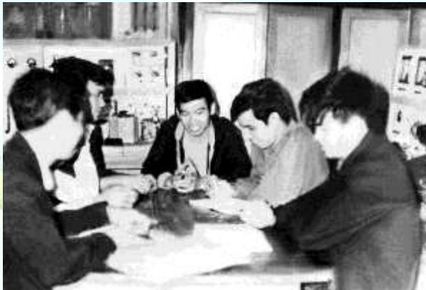
Tổ Cơ sở thời kỳ 1974 - 1976