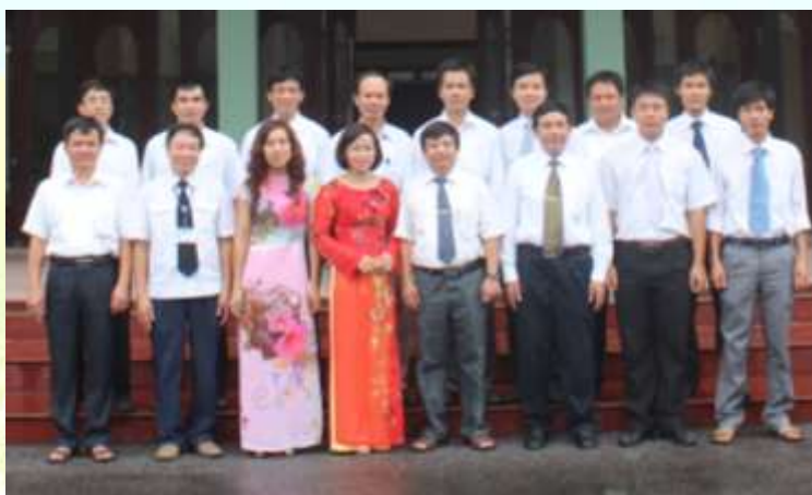
Tập thể GV Bộ môn Điện tử - Viễn thông