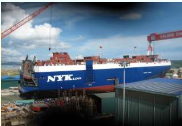
Công trình đóng mới tàu 4900 ô tô có sự đóng góp rất lớn công sức và trí tuệ của các thầy giáo và sinh viên khoa Điện - Điện tử tàu biển