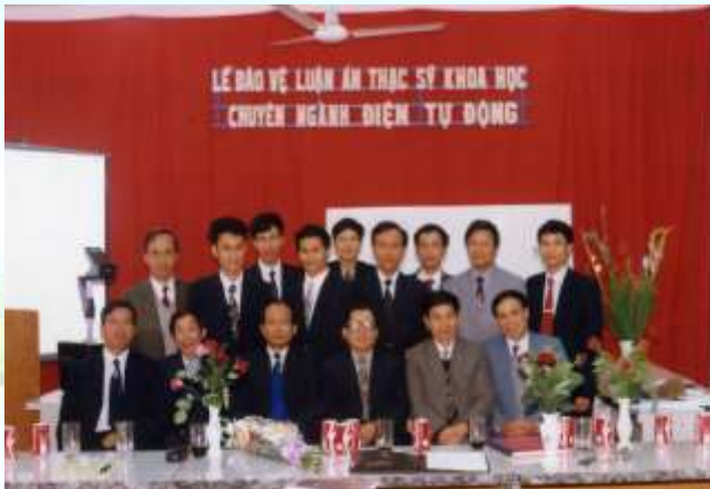
Lễ bảo vệ luận văn thạc sỹ khoa học chuyên ngành Điện tự động khóa 1