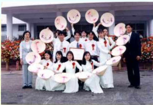
Tiết mục múa nón của đội văn nghệ Khoa đạt Huy chương vàng hội diễn văn nghệ toàn trường năm 2001