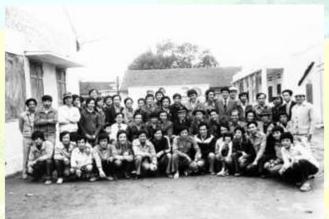
Gặp mặt Thầy Trò nhân dịp 20-11-1982