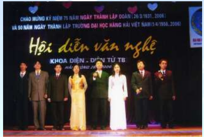
Tiết mục của các GV trẻ tại hội diễn văn nghệ chào mừng 50 năm Ngày thành lập Trường