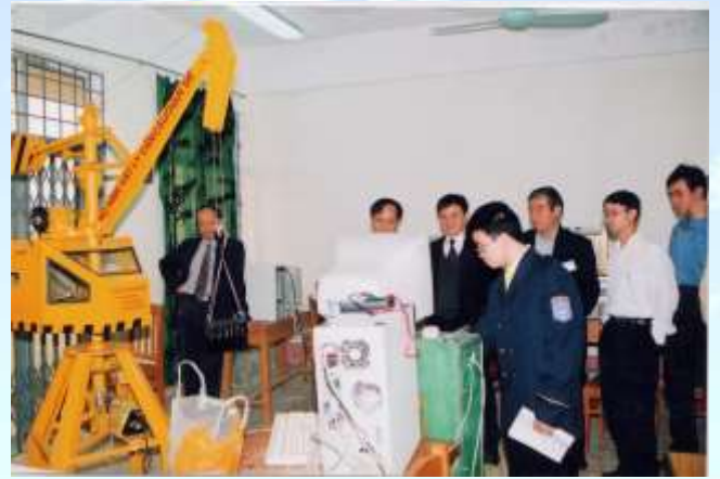
Mô hình vật lý đồ án tốt nghiệp sinh viên ngành Điện tự động công nghiệp K41