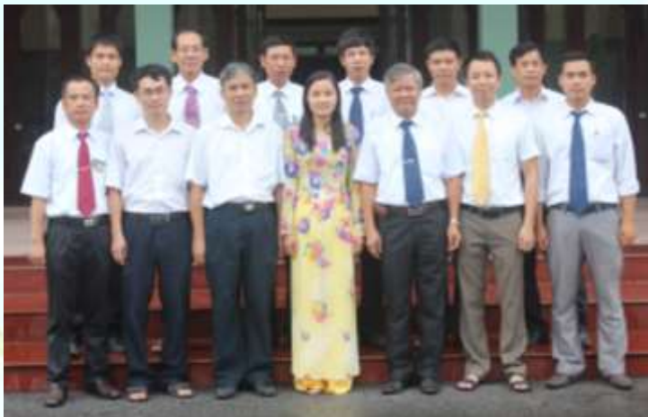
Tập thể GV Bộ môn Điện tự động tàu thủy